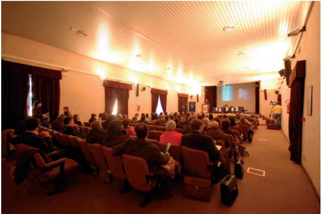
Il pubblico durante la III Conferenza di Ateneo sulla Didattica