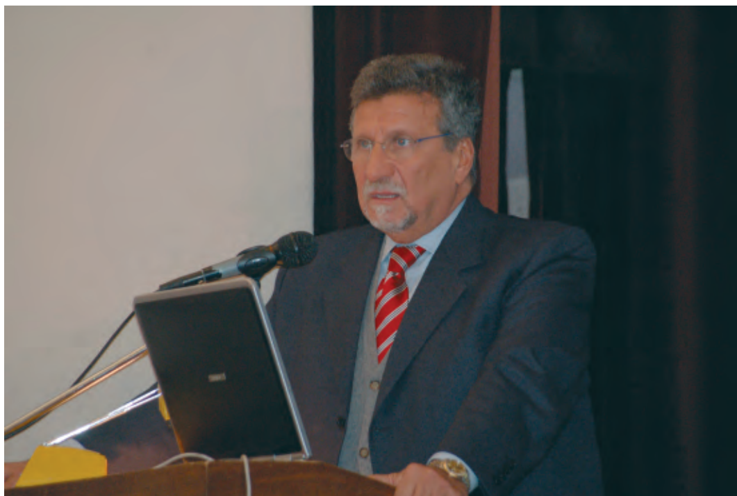
Il Rettore durante la III Conferenza di Ateneo sulla Didattica