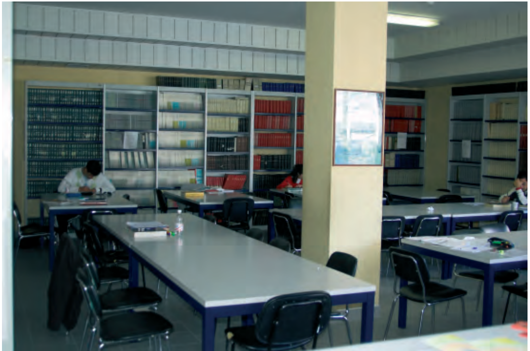
Sala lettura della Biblioteca "Carlo Urbani" del Polo di Scienze Biologiche e della Salute