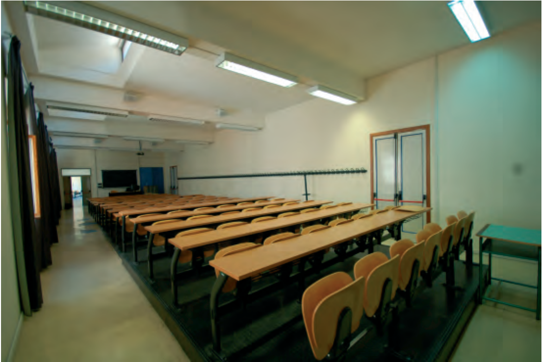
Aula della Facoltà di Economia